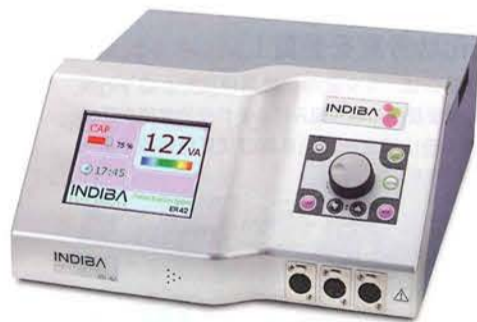
インディバ CRet System ER42

2011年10月下旬、同社は「脂肪滴・セルライトの除去と蓄積防止のためのインディバ+特殊プロビタミンC施術」の特許を取得した。これは特殊プロビタミンC(ビタミンC誘導体)を体内に摂り込みながらインディバ施術を行うという研究結果から編み出された技法で、2012年春頃にはこの技術を活用した新たな施術法の発表を予定しているとのこと。これにより業界に新たな旋風が巻き起こりそうだ。