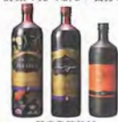
酵素発酵飲料 ファストサイズシリーズ