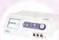
医療現場で用いられる インディバ