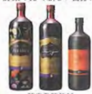
酵素発酵飲料 ファストサイズシリーズ